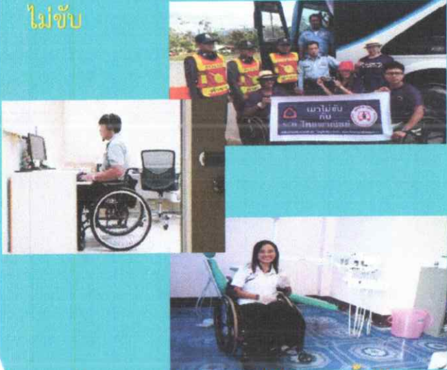
(สามารถดำเนินการได้ตลอดทั้งปี)

มาตรา 33 คือการที่นายจ้าง/สถานประกอบการรับคนพิการเข้าทำงานตามสัดส่วนที่กฎหมายกำหนด แต่ให้ไปทำงานสาธารณะประโยชน์ เช่น งานต้อนรับ/จัดคิวการให้บริการในโรงพยาบาล, งานรณรงค์แม่ไม่ขับ